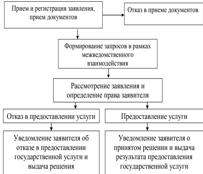
Блок-схема предоставления государственной услуги

Приложение 2 к административному регламенту предоставления администрации Петровского городского округа Ставропольского края государственной услуги «Предоставление информации, прием документов органами опеки и попечительства от лиц, желающих установить опеку (попечительство) над совершеннолетними лицами, признанными в установленном законом порядке недееспособными (ограниченно дееспособными)»